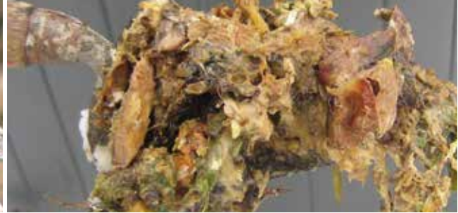
Wat te doen bij ongedierte of geurhinder?

zoals in een bos echte opruimers die hun steentje bijdragen tot de compostering. Ze zoeken meestal de droogste plaats op in de compost. Vaak is dat de verteerde compost. Zodra u die geoogst hebt en daarmee het nest definitief vernietigd hebt, is het probleem opgelost.