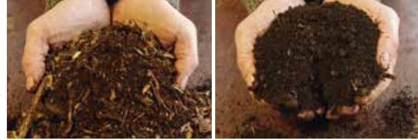
Het verschil tussen jonge compost (l) en rijpe compost (r)

en ruikt naar bosgrond. Sommige grondstoffen (vooral bruin materiaal) zijn nog wel te herkennen: notendoppen, stukjes snoeihout ... Deze compost is een stabiele humusgrond met langzaam werkende meststoffen, een onovertroffen bodemverbeteraar die het bodemleven stimuleert, het waterhoudend vermogen bevordert, ziekten voorkomt en de plant voedt.