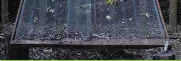
Een vering van een bed: ideaal om compost te zeven