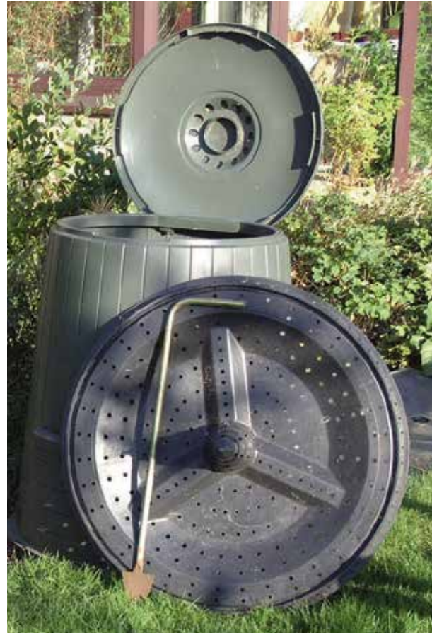
De onderdelen van het compostvat: bodemplaat, beluchtingstok, romp en deksel

Zorg ervoor dat de volledige bodemplaat op enkele stenen of tegels (bv. 7 of 9 stoeptegels) kan steunen zodat die plaat niet in de aarde zakt. Zorg er zeker voor dat ook het midden van de plaat degelijk wordt ondersteund, zo niet zal ze onvermijdelijk doorbuigen. De bodemplaat heeft een speciaal profiel en is van gaten voorzien om lucht in het vat te laten dringen. Die luchtstroom blijft slechts aan de gang als de plaat enkele cen-