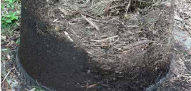
Wat als het compostierend materiaal te droog is?