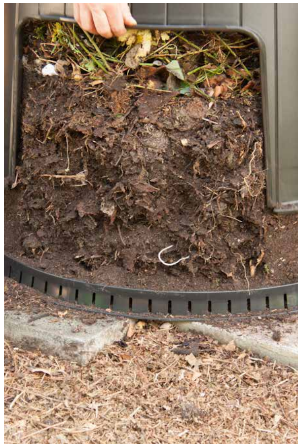
Compost oogsten? Til de romp van het vat over het gecomposteerde materiaal