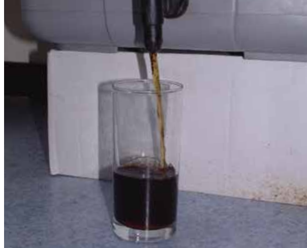
Percolaat uit de wormenbak

Omdat in de wormenbak de temperatuur amper boven de omgevingstemperatuur uit stijgt, verliezen zaden van bijvoorbeeld