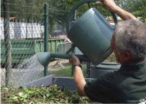
Breng de vochtigheid van het composterend materiaal op peil