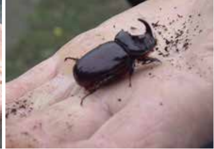
Verskillende ontwikkelingsstadia van de neushoornkever