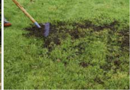
Compostgebruik in moes- en fruittuin, of op het gazon