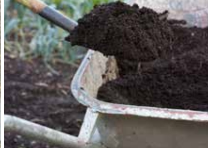
Compostbakken met een uitneembare voorzijde vergemakkelijken het omzetten