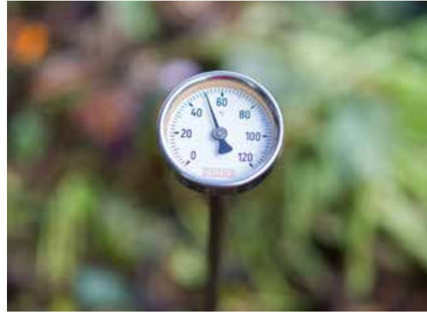
Tijdens het composteren kan de temperatuur aardig oplopen

Zijn alle voorwaarden (voedsel, vocht en lucht) vervuld, dan zetten de compostorganismen zich aan het werk. Verwerkt u grote hoeveelheden (meer dan een paar kruiwagens) organisch materiaal in één keer, dan neemt de temperatuur sterk toe. Temperaturen van 50 °C zijn courant en zelfs 60 °C en 70 °C zijn geen uitzondering. We noemen dit de broei. Tijdens de broei zijn uitsluitend micro-organismen (zoals schimmels en bacteriën) actief. Zij verbruiken, in deze fase veel zuurstof. Zonder bruin materiaal loopt het hier fout. Wanneer na enkele weken of maanden de afgekoelde compost wordt omgezet en