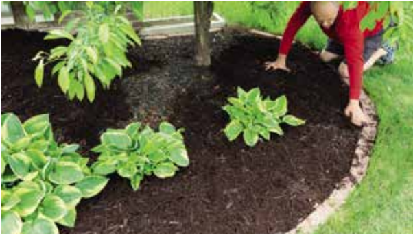
Mulchen met compost