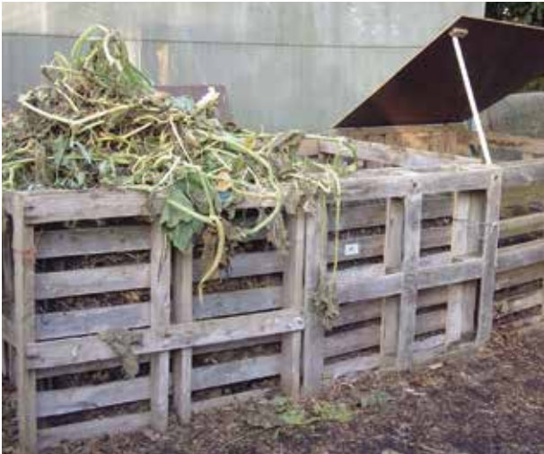
Drie compostbakken naast elkaar plaatsen, werkt het handigst

gens de ruimte en de hoeveelheid tuinresten die u verwacht. De hoeveelheid tuinresten is echter moeilijk in te schatten. In de loop van de maanden waarin u een compostbak vult, zorgt de vertering immers al voor een vermindering van het volume. In een compostbak van 1 \text{ m}^3 kunt u een veelvoud daarvan aan groenresten verwerken.