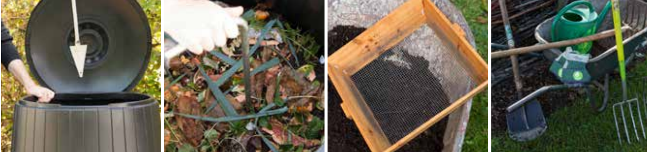
Enkele hulpmiddelen: beluchtingsstok, zeef, riek, mesthaak ...