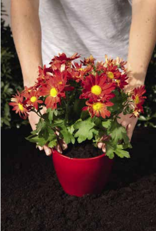
Compostgebruik in bloempotten en -bakken