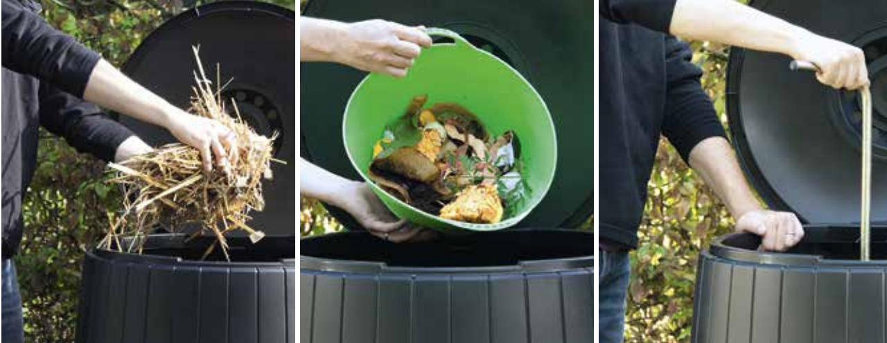
Het vullen van het compostvat: een ruwe beddinglaag, tuin- en keukenresten, beluchten

materiaal: houtsnippers, fijne takjes en dorre stengels van vaste planten. Dat verzekert gedurende de eerste maanden een vlotte instroom van lucht en voorkomt dat de luchtgaten verstopt raken.