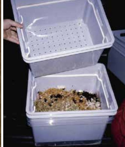
De 2 meest gebruikte wormenbaktypes (monobak en stapelbak) en de gaatjes in de geperforeerde bak