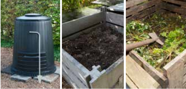
Compostvat en compostbakken