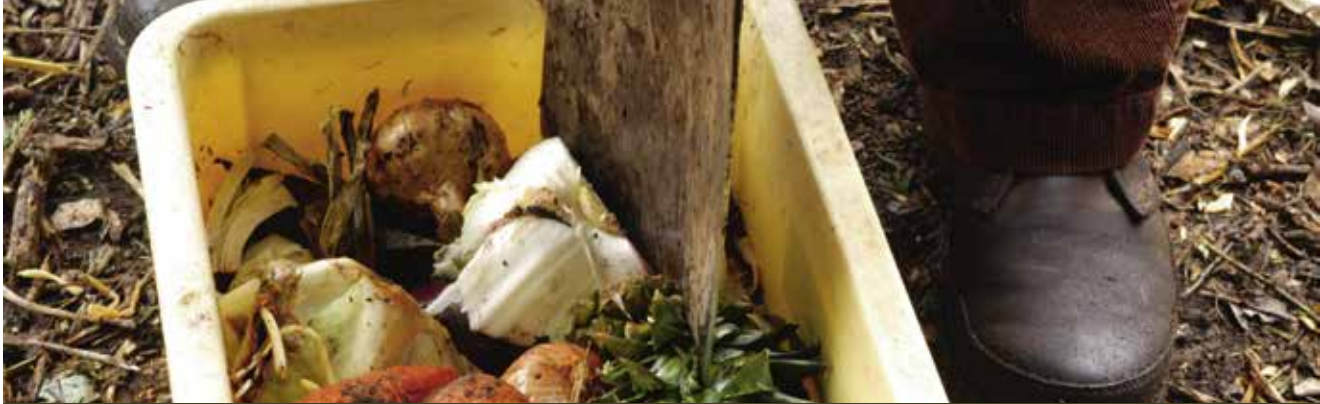
Verklein wat te grof of te lang is