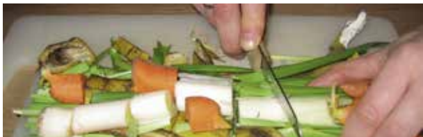
Wanneer u het ingangsmateriaal verkleint, verteert het sneller

Opgelet: In het laatste geval kan het ook zijn dat de wormen vluchten uit de verzuurde massa dieper in de bak, of dat het percolaatniveau erg hoog staat (zie verder). Graaf dus iets lager om dit na te gaan.