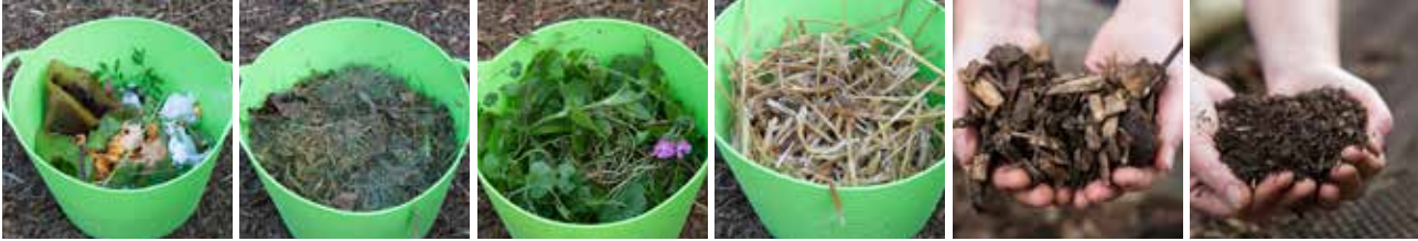
Voorbeelden van 'groen' materiaal