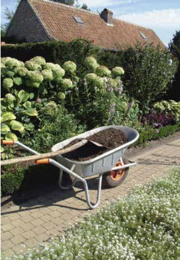
Compost, klaar voor gebruik in de tuin