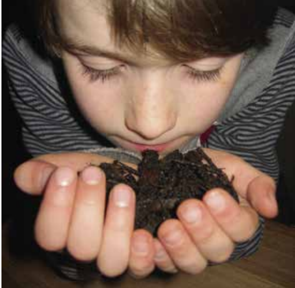
De kijk- en ruiktest